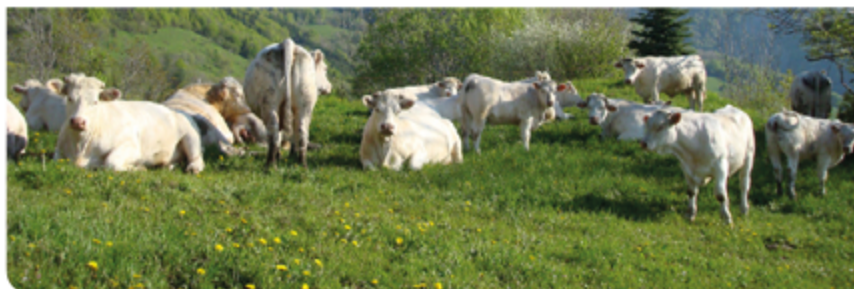
Herd Book Charolais - Agropôle du Marault - 58470 Magny-Cours - France